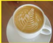
เมนูเครื่องดื่มที่ต้องรู้