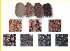
การคั่วกาแฟและผลกระทบต่อรสชาติ