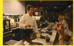
การชิมเพื่อการทดสอบรสชาติของกาแฟ