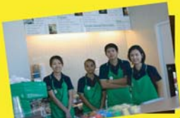
Barista และพนักงานในร้านกาแฟ