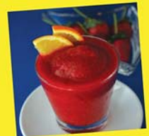
การทำเครื่องดื่มกาแฟ ร้อน เย็น ปั่น และการสร้างสรรค์เครื่องดื่มใหม่ๆ ด้วยตนเอง