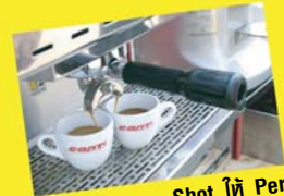
การทำ Espresso Shot ให้ Perfect